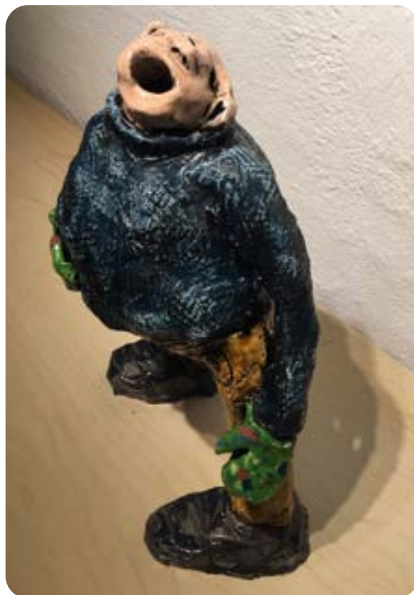
Figurene her er lavet af Anne Kleberg

Vis billeder af Søren Wullums humoristiske figurer – tykke og tynde med lange bryster og maver – i sommertøj og vintertøj.